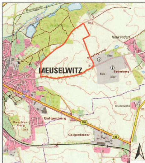
Abb. 1: Lage des Plangebietes (DTK25 © TLBG & LVermGeo LSA, 2021)