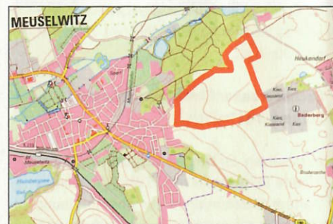
Abb. 2: Lage des Plangebietes (DTK25 © TLBG & LVermGeo LSA, 2021)