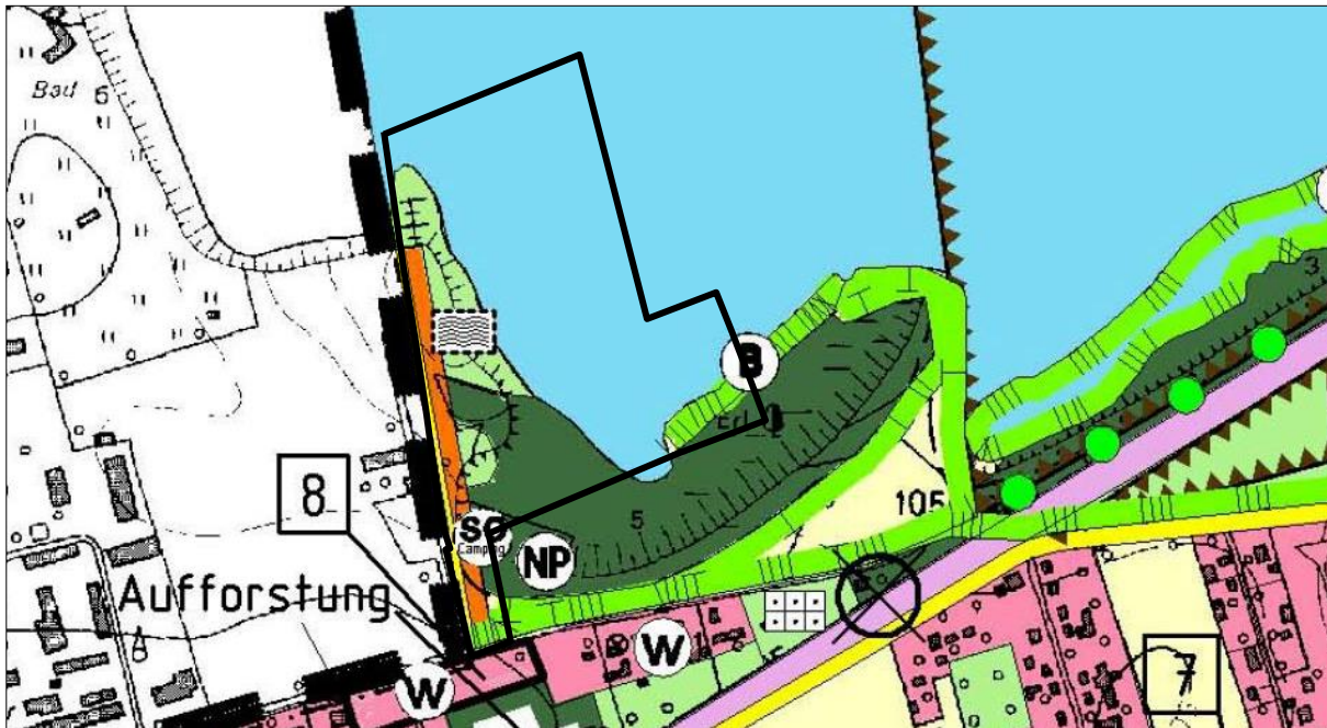
Abb. 1: Auszug aus dem wirksamen Flächennutzungsplan der Gemeinde Doberschütz, nicht maßstäblich