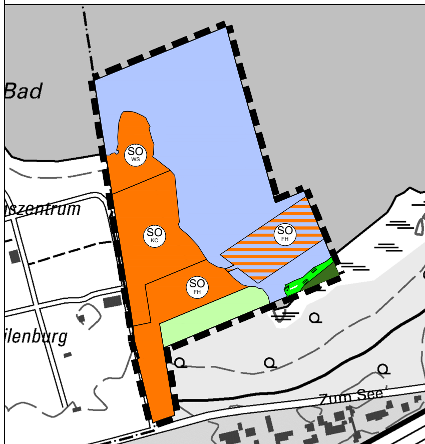
Darstellung der 3. Änderung des Flächennutzungsplans der Gemeinde Doberschütz