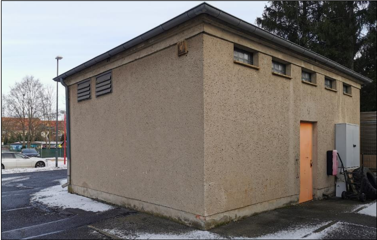
Abb. 10 Innenansichten des Gebäudes Nr. 2