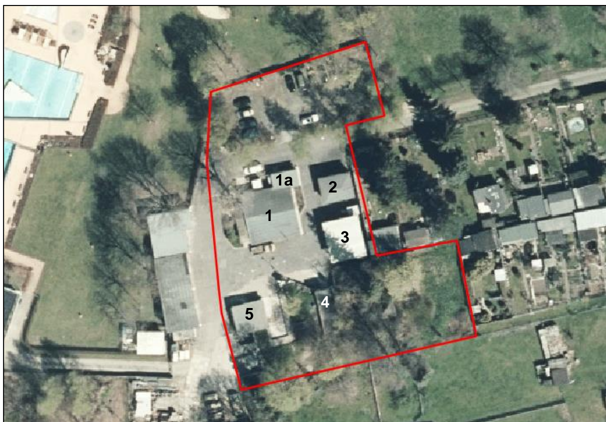
Abb. 7 Detailsicht Geltungsbereich mit Nummerierung begutachteter Gebäude