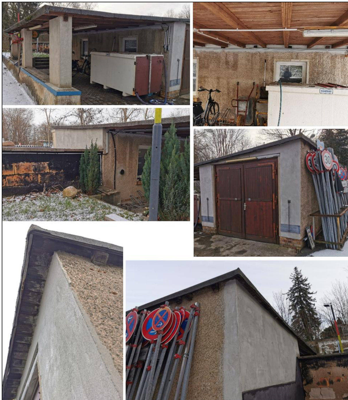
Abb. 13 Ansicht des Gebäudes Nr. 5