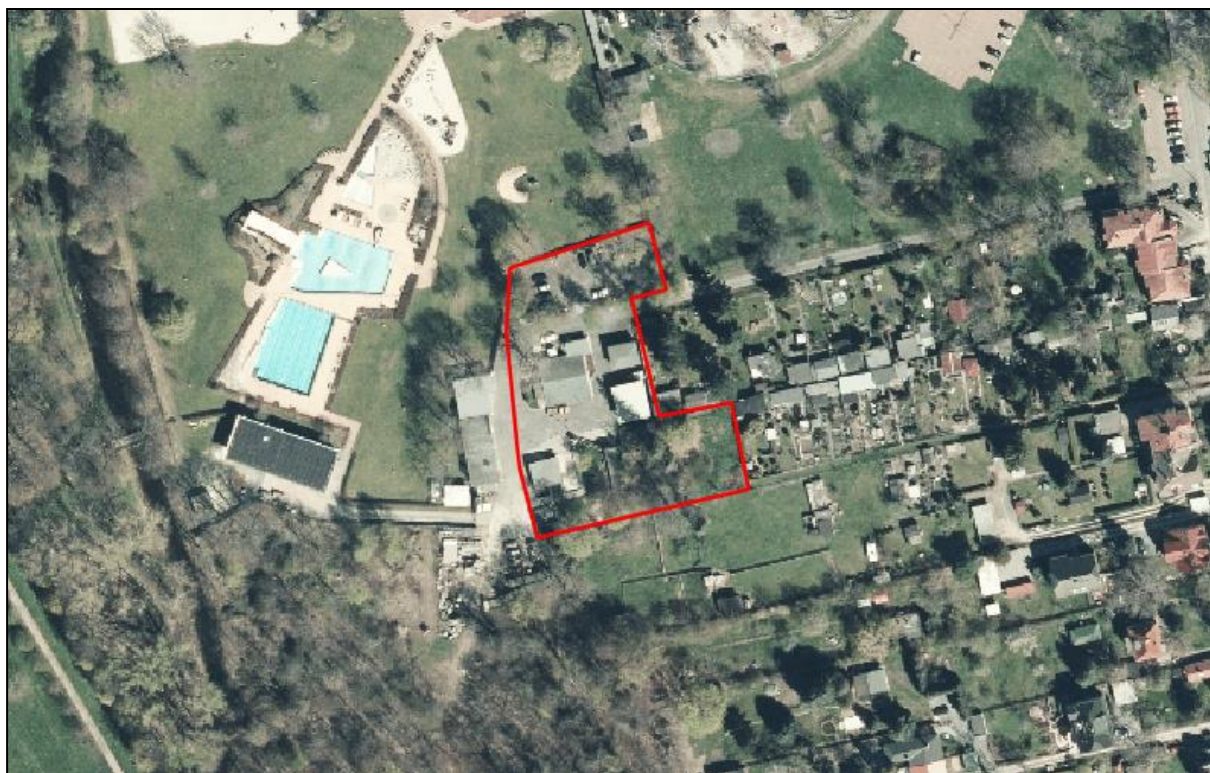
Abb. 6 Abgrenzung Lage Geltungsbereich (rot) bebauten Zusammenhang