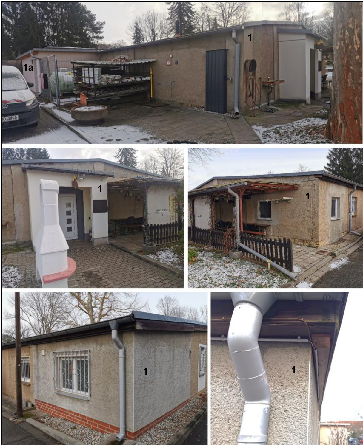
Abb. 8 Aufnahmen der Gebäude Nr. 1a (oben links) und 1