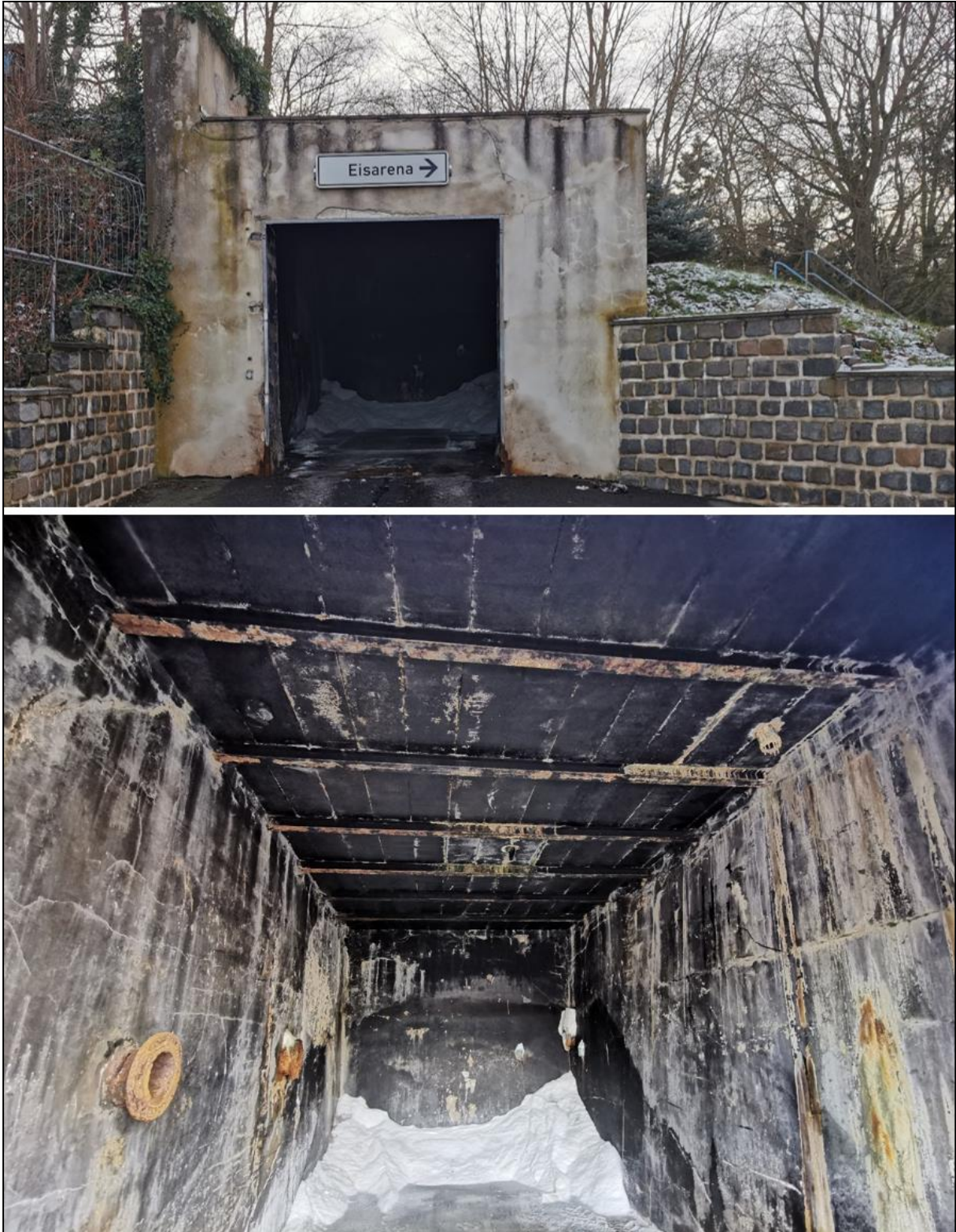
Abb. 12 Ansichten des Gebäudes Nr. 4 (Salzlager)