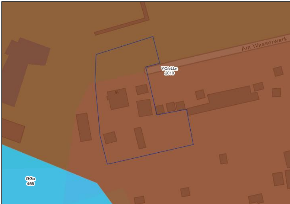
Abb. 4 Bodentypen im Plangebiet (blaue Umrandung)