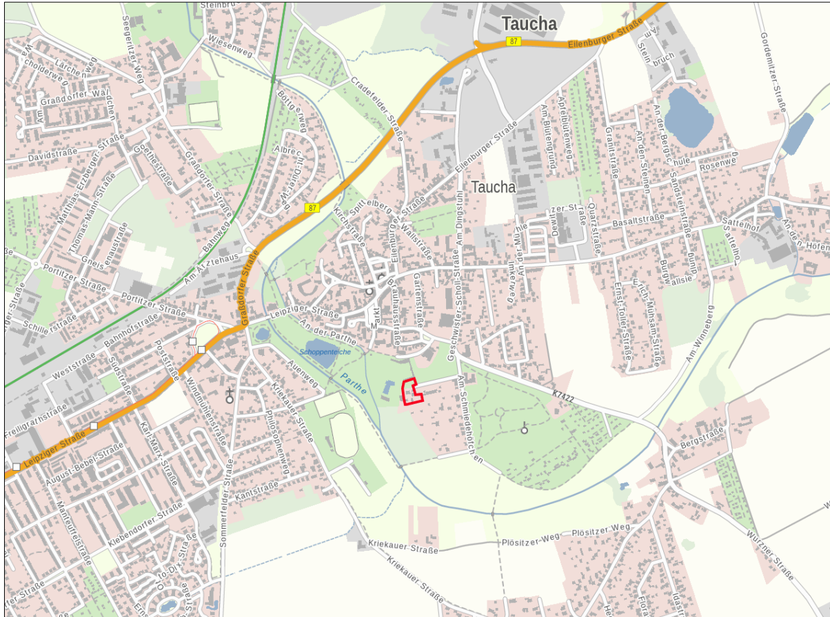
Abb. 1 Lage des Plangebiets in der Stadt Taucha

Das Plangebiet liegt in der Stadt Taucha im Landkreis Nordsachsen. Der Geltungsbereich befindet sich südlich des Stadtkerns der Ortslage und umfasst die Fläche des derzeitigen Bauhofs Taucha sowie den nördlich angrenzenden Parkplatz.