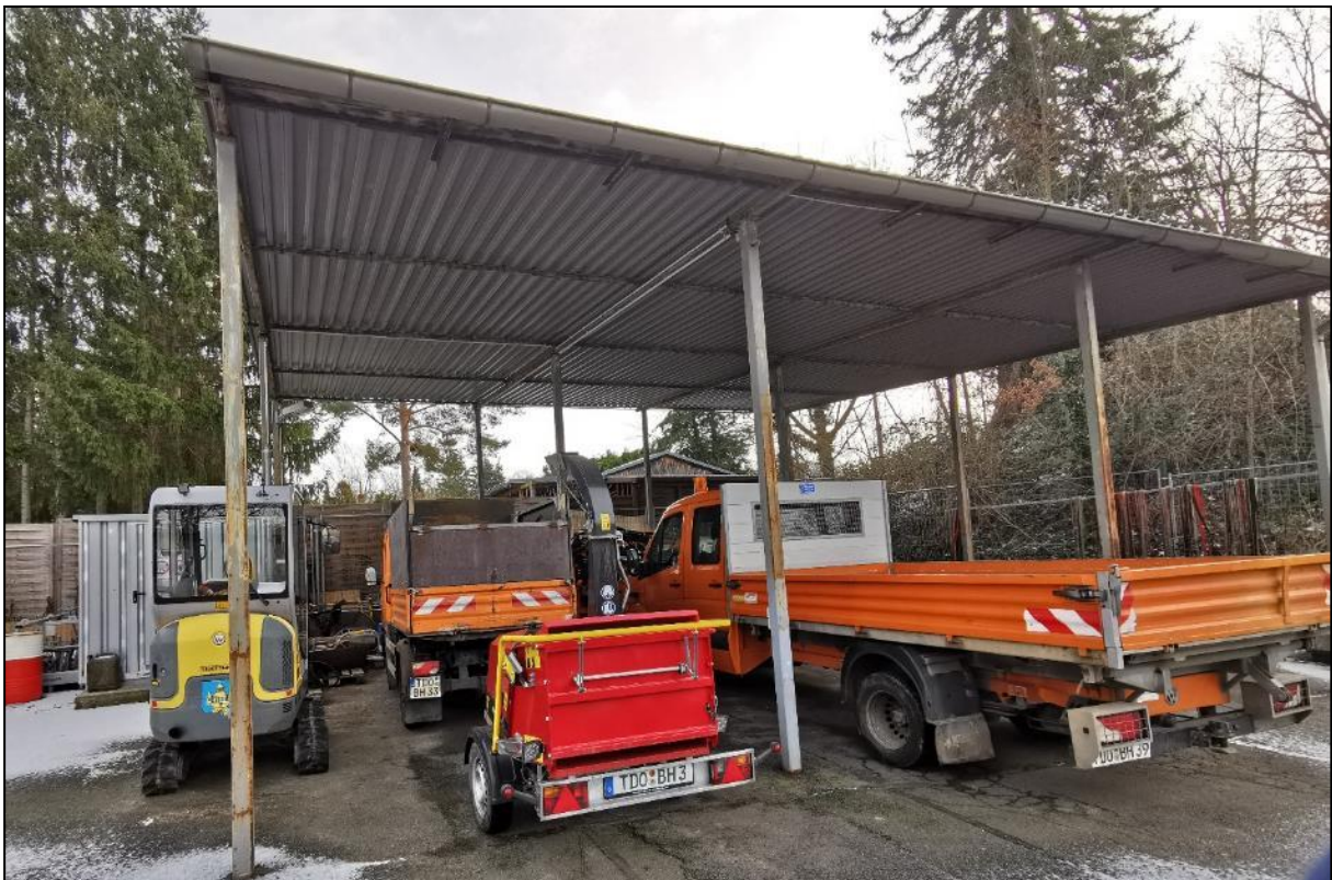
Abb. 11 Ansichten des Gebäudes Nr. 3 (Carport)