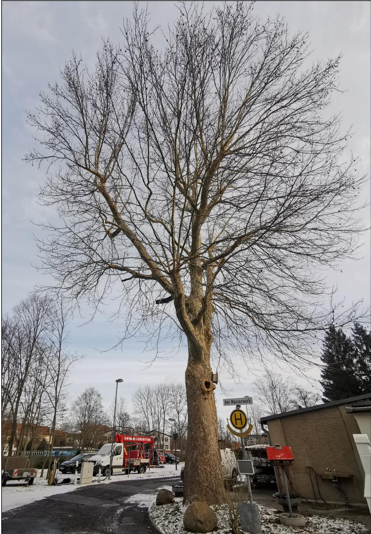
Abb. 9 Altbaum (Platane) an der nordöstlichen Ecke von Gebäude 1