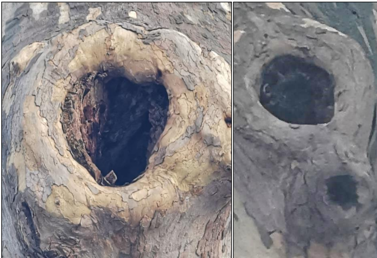
Abb. 5 Faulstellen am Stamm der Platane, links: Südseite, ca. 15 cm Durchmesser mit Höhlung, rechts: Nordseite, ca. 10 cm Durchmesser ohne Höhlung

Der Geltungsbereich ist derzeit geprägt von mehreren sanierungsbedürftigen Gebäuden des örtlichen Bauhofs und den entsprechenden Nebenanlagen. Die nördlich im Plangebiet vorhandenen Stellplätze sind von jungen (Weißtanne [ Abies alba ], Eibe [ Taxus baccata ], Hainbuche [ Carpinus betulus ]) bis mittelalten (Spitzahorn [ Acer platanoides ], Hainbuche) Gehölzen umgeben. Unmittelbar südlich davon befindet sich eine alte, stark eingekürzte Platane ( Platanus hispanica ) mit einem Stammdurchmesser von ca. 1 m und auf der Südseite auf ca. 4 m Höhe eine ca. 15 cm breite Faulstelle mit nach unten reichender Höhlung (Tiefe unklar, vgl. Abb. 5). Auf der dem Norden zugewandten Seite befindet sich ebenfalls eine Faulstelle (in ca. 6-7 m Höhe, Durchmesser ca. 10 cm, vgl. Abb. 5), die jedoch nur wenige cm in den Stamm hineinreicht und keine Habitateignung für Vögel und Fledermäuse bietet.