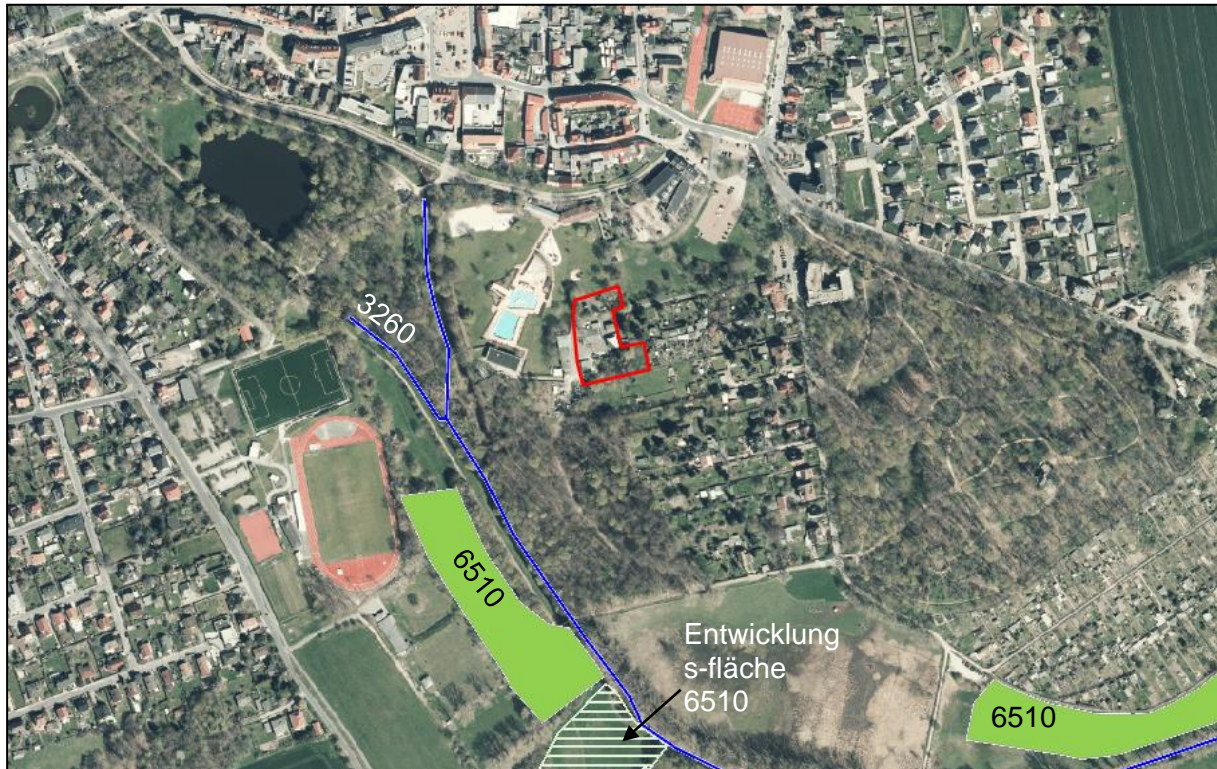
Abb. 16 Lebensraumtypen im FFH-Gebiet (LfULG, 2024) und Lage des Plangebiets (rote Umrandung).

Die Bauarbeiten zur Errichtung eines Bürogebäudes (nördlicher Geltungsbereich) und der anschließende Abriss eines alten Gebäudes (zentraler Geltungsbereich) finden außerhalb von LRT statt. Die nächstgelegenen LRT 3260 und 6510 sind in Abb. 16 dargestellt. Eine Beeinträchtigung ist aufgrund der Entfernung (mind. ca. 120 m) auszuschließen. Indirekte Beeinträchtigungen (z.B. stoffliche Wirkungen) in das Gebiet sind nicht zu erwarten.