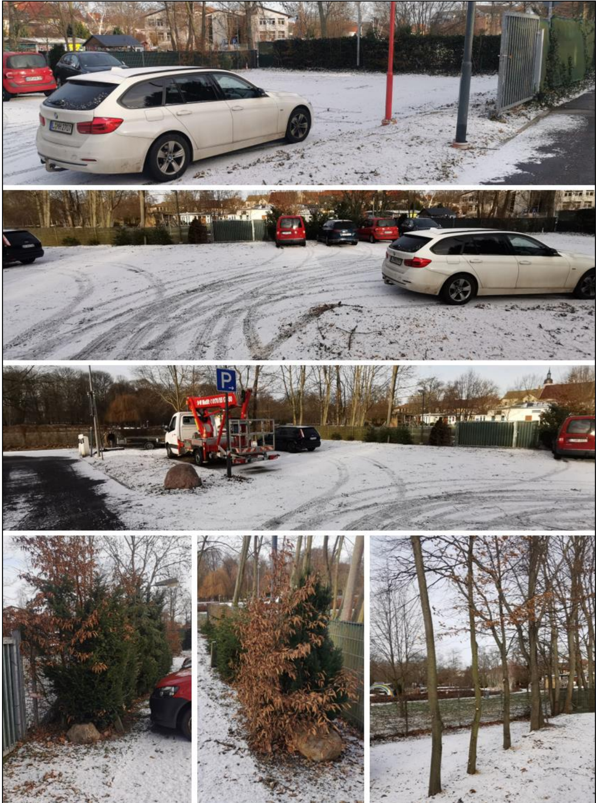
Abb. 14 Ansicht der nördlichen Stellplätze, auf denen das neue Gebäude entstehen soll