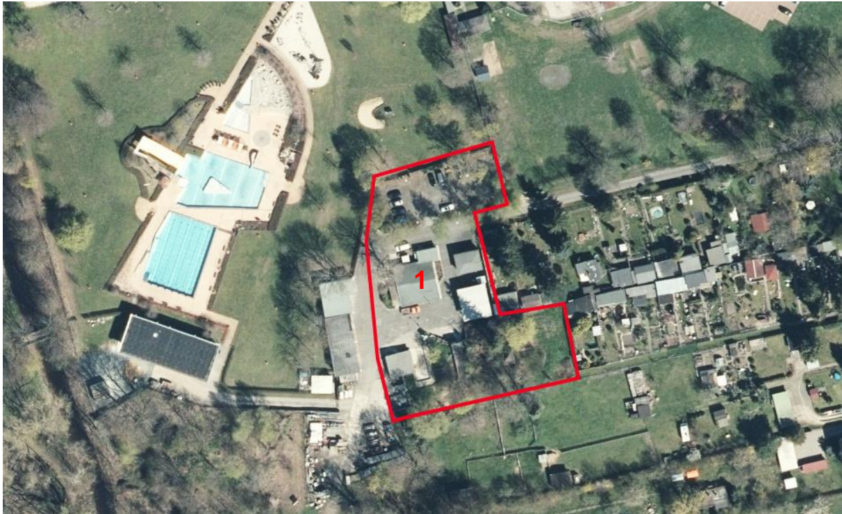
Abb. 2 Geltungsbereich und Umgebung (© RAPIS, 01/2024)

Der Geltungsbereich umfasst den östlichen Teil des bestehenden Bauhofs sowie die nördlich angrenzenden Flächen, welche derzeit als Stellplätze genutzt werden. Innerhalb des Geltungsbereichs befinden sich mehrere sanierungsbedürftige Gebäude bei denen es sich um ehemalige Baracken des früheren Wasserwerks handelt. Derzeit werden sie als Lager- und Büroräume sowie als Garagen genutzt. Insgesamt stellt sich ein Großteil der Gebäude als dringend sanierungsbedürftig dar.